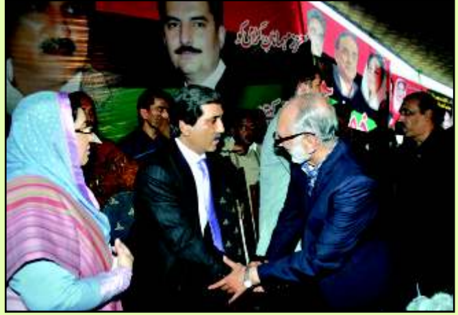
سابق گورنر پنجاب مخدوم احمد محمود کے سیالکوٹ کے دورہ کے دوران ڈاکٹر فردوس عاشق اعوان SDPT کے چیئرمین محمد اسحاق بٹ کا ان سے تعارف کروا رہی ہیں۔