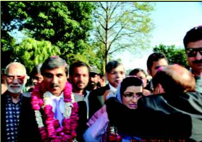
سابق گورنر پنجاب مخدوم احمد محمود ڈاکٹر فردوس عاشق اعوان SDPT کے چیئرمین محمد اسحاق بٹ اور سیالکوٹ پیپیر کے صدر عبدالجید شیخ جلسہ گاہ میں تشریف لارہے ہیں۔