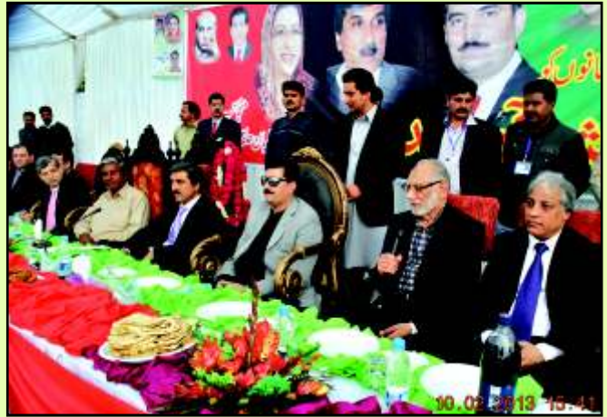
سابق گورنر پنجاب مخدوم احمد محمود، سابق اسپیکر قومی اسمبلی فیصل کریم کنڈی، SDPT کے چیئرمین محمد اسحاق بٹ اور رضا منیر اسٹیج پر تشریف فرما ہیں۔