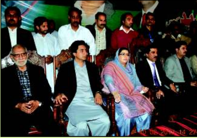
سیالکوٹ میں ایک جلسہ کے انعقاد کے موقع پر سابق گورنر پنجاب مخدوم احمد محمود، سابق ڈپٹی اسپیکر قومی اسمبلی فیصل کریم کنڈی اور SDPT کے چیئرمین محمد اسحاق بٹ اسٹیج پر نظر آ رہے ہیں۔