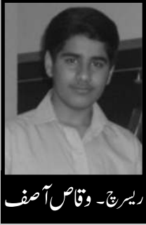
ریسرچ - وقاص آصف

Suggestion. Necessary amendments in rules / procedures / laws be made if bonded carrier discharges its liability i.e. container handed over with custom seal intact, the drivers and vehicles should not be detained and in case of accident, the container should not be withheld / detained with the vehicle.