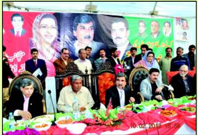
سابق گورنر پنجاب مخدوم احمد محمود سیالکوٹ میں جلسہ کے دوران حاضرین سے خطاب فرما رہے ہیں، SDPT کے چیئرمین محمد اسحاق بٹ بھی اسٹیج پر نظر آ رہے ہیں۔